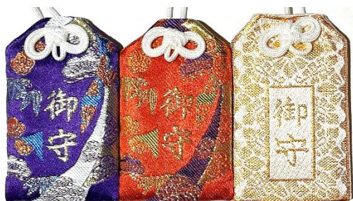
御守袋 紫・赤・白